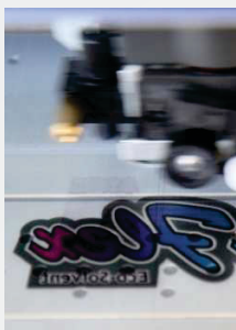
štampa u ogledalu

Prije prijenosa dizajna, boja mora biti suha inače bi se štampa mogla razmazati. Za ovo je potrebno od jednog do šest sati a zavisi od boje koja se koristi i uslova ambijenta. Isječene i odljepljene skripte, ili dizajni, ispeglani su i raljepljeni na tekstil za 15 sekundi na 160°C. Postavljena rolna može se ukloniti nakon kratkog vremena hlađenja.