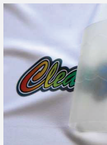
uklonite foliju i gotovo

Čuvati na hladnom i suvom mjestu, zaštićenom od uticaja svjetla. Savjetujemo vam da ne prekoračite predviđeni period upotrebe od 36 mjeseci. Tehničke specifikacije oslanjaju se na brojne testove i tehničke resurse. Zbog raznih mogućih uticaja tokom refiniranosti i upotrebe, specifikacije treba posmatrati kao referentne vrijednosti. Preporučujemo prikladni test na originalnom materijalu. Pravno obvezujuća garancija specifičnih karakteristika ne može biti izvedena iz naših specifikacija.