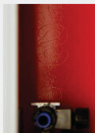
Rezanje kao u ogledalu