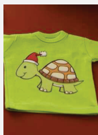
Uklonite foliju, gotovo!

Čuvati na hladnom i suvom mjestu, zaštićenom od uticaja svjetla. Savjetujemo vam da ne prekoračite predviđeni period upotrebe od 36 mjeseci. Tehničke specifikacije oslanjaju se na brojne testove i tehničke resurse. Zbog raznih mogućih uticaja tokom refiniranosti i upotrebe, specifikacije treba posmatrati kao referentne vrijednosti. Preporučujemo prikladni test na originalnom materijalu. Pravno obavezujuća garancija specifičnih karakteristika ne može biti izvedena iz naših specifikacija.